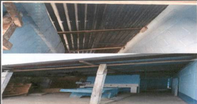
Foto 2: Sustitucion de estructura de soporte de madera, por metal.