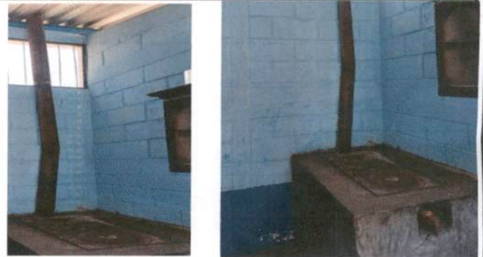
Foto 10: Sustrucción de Chimenea de Metal y plancha de metal de 3 hornillas e instalación de azulejo en estufa rural.